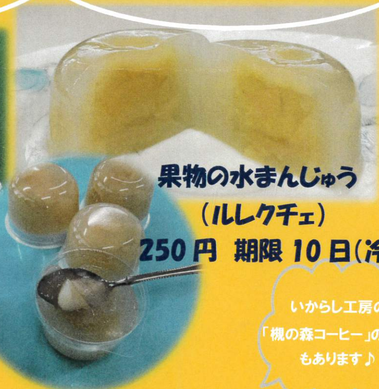
果物の水まんじゅう (ルレクチェ)