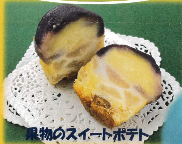
果物のスイートポテト (なし・ルレクチェ)

果物の果肉、果汁を贅沢に使った水まんじゅうです。口の中いっぱい果物の風味を感じるお菓子が出来上がりました♪