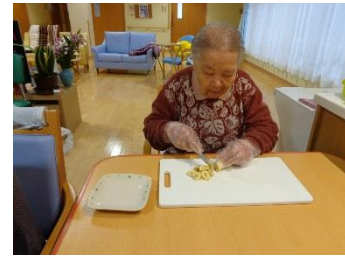
生クリームや果物をデコレーション