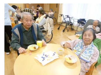
皆さんで食べました!(^^)!