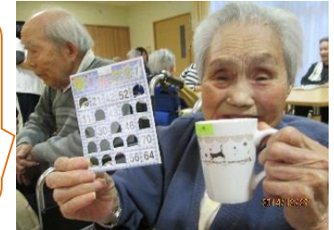
ビンゴ大会ではみなさん真剣！！