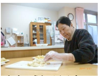
これをこう切るんかね？