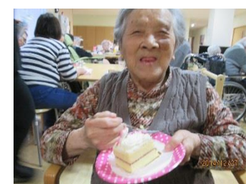
甘いものはおいしいね♪