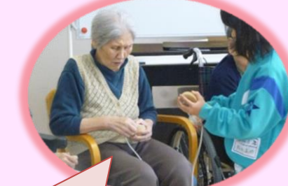
これをこうやんだかね。